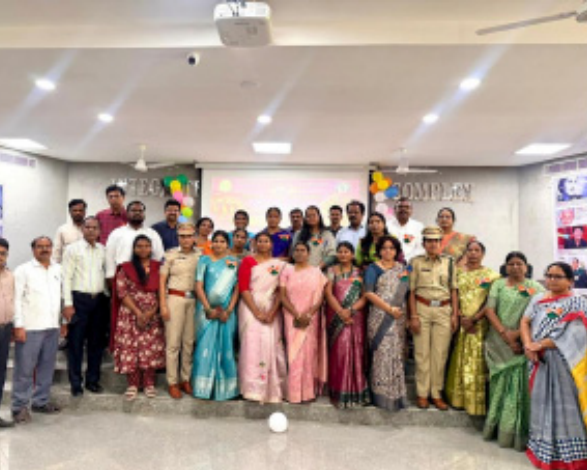
వివిధ శాఖల్లో ప్రతిభ కనబరిచిన మహిళా ఉద్యోగులను ఈ సందర్భంగా సన్మానించారు. సమాజ నిర్మాణంలో మహిళల పాత్ర కీలకమని కొనియాడారు. కార్యక్రమంలో జిల్లా అధికారులు, ప్రజాప్రతినిధులు, మహిళలు తదితరులు పాల్గొన్నారు.